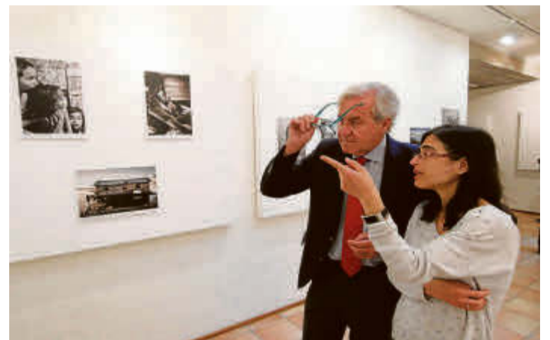
Inauguración de la exposición.

EL Consejo Social del Rollo celebra su Semana de Las Artes Escénicas hasta el viernes en el Centro Miraltormes con récord de participación con diez grupos que harán teatro, musicales, recital de poesía, danza del vientre, bailes y música. C.A.S.